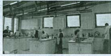
Guten Appetit: In der neuen Schulküche wird bereits kräftig gekocht.