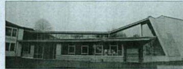
Neues und Altes fließt zusammen: Das Architekturbüro plus + hat gemeinsam mit Mutpol das neue Kommunikationszentrum in einem gemeinsamen Prozess entwickelt. Ökologische Akzente: Der große Einsatz von Holz sowie das begrünte Vordach.

ling die Farbgebung auf: Den Sichtbeton haben Schüler in einem warmen Gelb/Braun-Ton lasiert, passend zum dominierenden Holz an Bühne, umlaufender Galerie und hohem, offenem Dach. Auch Konferenzraum und Küche haben einen freundlichen Anstrich. „Die Architekten haben einen Farbberater hinzugenommen“, lobt Kießling die „sehr angenehme Zusammenarbeit“ mit den Planern: „Sie sind auf jeden Wunsch eingegangen, und wir haben immer wieder zusammengegessen.“ Damit die Schüler sich mit ihrer Schule identifizieren – was auch vor Vandalismus schützen soll – haben Planer und Schulleitung diese in die Vorbereitung mit einbezogen.