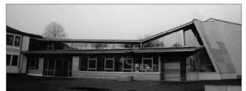
Neues und Altes fließt zusammen: Das Architekturbüro plus + hat gemeinsam mit Mutpol das neue Kommunikationszentrum in einem gemeinsamen Prozess entwickelt. Ökologische Akzente: Der große Einsatz von Holz sowie das begrünte Vordach.

Rund 1,5 Millionen Euro hat Mutpol in den Bau des neuen Kommunikationszentrums investiert. Eingeflossen sind Zuschüsse des Bundes. Das Gebäude mit einer Grundfläche von rund 400 Quadratmetern ist in einer Bauzeit von rund einem Jahr entstanden und Teil eines Gesamt-Sanierungspakets. Dieses wurde 2006 begonnen (Umbau Gruppenhäuser zu Schulhäusern) und wird in diesem Jahr mit dem Umbau des Gemeinschaftshauses in eine Turnhalle sowie dem Neubau einer Projektwerkstatt abgeschlossen. Die Diakonische Jugendhilfe Mutpol Tuttlingen e.V. unterstützt Kinder, Jugendliche und ihre Eltern dabei, „aktiv am sozialen Leben teilzunehmen, soziale Anerkennung zu erlangen und schwierige Lebenssituationen zu meistern“ und betreut auf dem Gelände rund 150 Schüler inklusive Berufsschülern, zusammen mit Außenstellen rund 250 Schüler. Insgesamt sind rund 70 Lehrkräfte, davon 40-50 vor Ort, tätig. (fil)