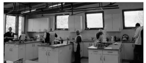
Guten Appetit: In der neuen Schulküche wird bereits kräftig gekocht.